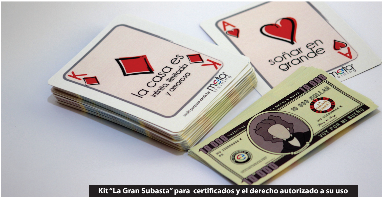
Kit "La Gran Subasta" para certificados y el derecho autorizado a su uso